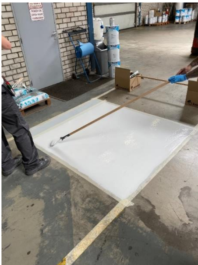
Aanbrengen 2 e laag na 2 uur drogen