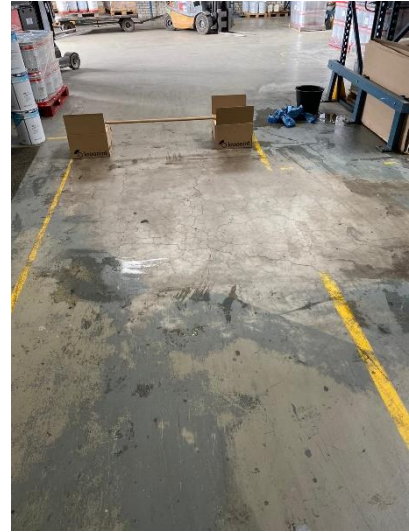
Naspoelen met schoon water en laten drogen