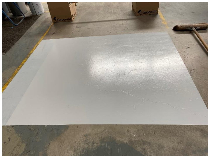
Resultaat 4 uur na de eerste laag