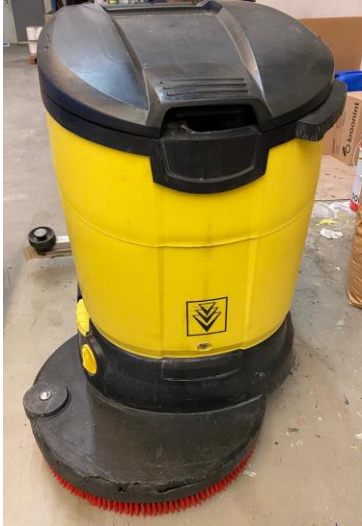
Vloer reinigen bij voorkeur met een Schrob-zuig machine met schuurnet P80 en met KP Clean