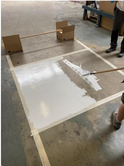
Aanbrengen 1 e laag met minimaal 15% water